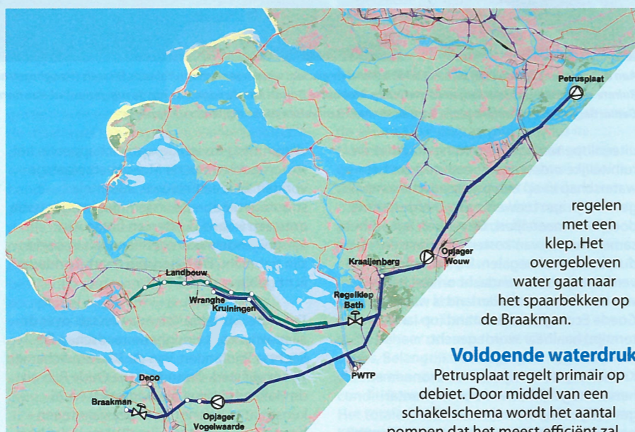
Afb. 1: Het watertransportsysteem van de Biesbosch naar Zeeuws-Vlaanderen.

Om de positieve ervaringen van Arens in het juiste perspectief te kunnen plaatsen, is het essentieel om nog eens goed naar de verschillen tussen het bestaande en het vernieuwde watertransportsysteem in de Biesbosch te kijken. In de oude situatie verpompte het pompstation op de locatie Petrusplaat van Evides het water uit de spaarbekkens in het transportsysteem (zie afbeelding 2). Opjager Wouw zorgde voor een drukverhoging, zodat onder andere Bath en Kraaijenberg water onder voldoende druk krijgen. De opjager van Bath leverde water aan de industrie en de landbouw in Midden-Zeeland. De pompen van Kraaijenberg leverden water via opjager